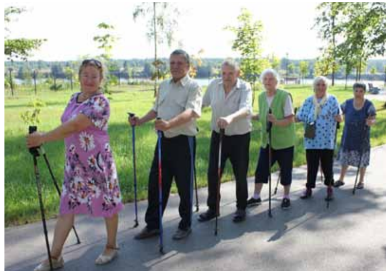
Эффективность работы пансионата признана и на региональном, и на федеральном уровнях.

Пансионат начал свою работу в 2014 году, первоначально разместившись на собственной, огороженной территории, в двухэтажном здании, выполненном в стиле «сталинский классицизм». В марте 2022 года была открыта вторая площадка загородного дома в 3 этажа просторных благоустроенных, уютных номеров. В общей сложности сейчас два корпуса пансионата могут принять более 200 человек. Здесь за постояльцами пансионата осуществляется постоянное медицинское наблюдение, проходит восстановление здоровья – по назначению лечащего врача и индивидуально разработанным программам. Организован досуг для пожилых людей – лечебная физкультура, прогулки на свежем воздухе, скандинавская ходьба. Проводятся индивидуаль-